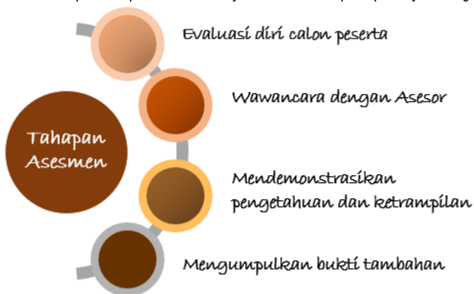
Gambar 2: Tahapan Asesmen RPL

Jika, menurut informasi yang diberikan dalam evaluasi diri, calon tersebut menunjukkan potensi untuk dapat mengikuti RPL, maka pada tahap berikutnya adalah pengumpulan bukti lebih lanjut melalui wawancara. Dengan wawancara ini, calon dan asesor berkesempatan untuk melakukan percakapan profesional tentang pengetahuan dan keterampilan yang dibutuhkan. Wawancara ini dapat berupa serangkaian pertanyaan langsung atau berupa daftar topik untuk diskusi yang diambil dari daftar keterampilan dan pengetahuan yang dibutuhkan. Diskusi seputar topik dapat memberikan kesempatan bagi calon untuk mendemonstrasikan bidang pengetahuan dan pengalamannya secara lebih luas dan dapat memperoleh lebih banyak informasi daripada pertanyaan langsung.